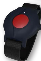
Draadloze zender S87

Het NC8 systeem is ontworpen met het oog op de toekomst en kan eenvoudig worden aangepast aan uw veranderende behoeften. Het uitbreidbare radioprotocol en de mogelijkheid om dementie- en lokaliseringsfuncties te activeren wanneer dat nodig is, maken het NC8-systeem tot een langetermijn-investering in de veiligheid van uw bewoners.