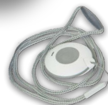
Draadloze zender Tx met halskoord

Scan de QR-code voor gedetailleerde productinformatie.