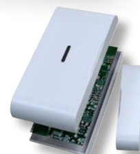
RAC magnetische contactdetector

Scan de QR-code voor gedetailleerde productinformatie.