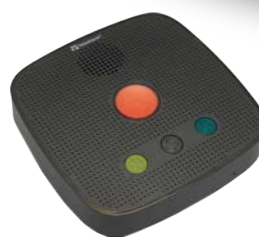
Personenalarmtoestel TA74 Zwart